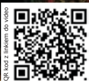
QR kod z linkiem do video