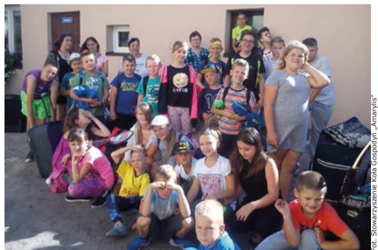
Fot. Stowarzyszenie Koła Gospodyń „Amarylis”